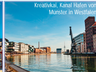
Kreativkai, Kanal Hafen von Münster in Westfalen