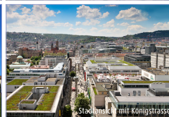
Stadtsicht mit Königstraße